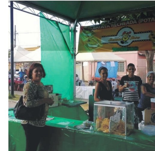
28 e 29/04 - 2ª Feiccamp