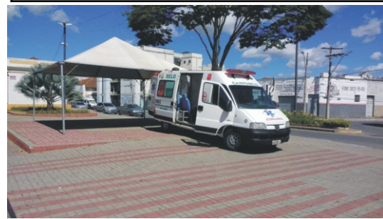
28 e 29/04 - 2ª Feiccamp