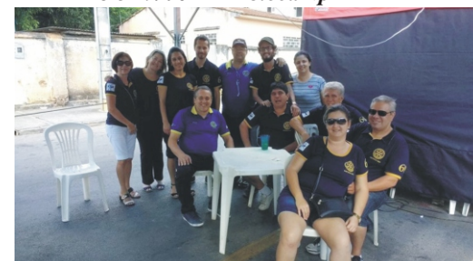
28 e 29/04 - 2º Feiccamp