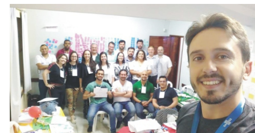
28 a 30/08 - Curso Bootcamp