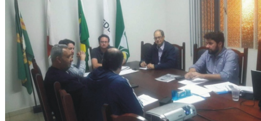
01/08 - 1ª Reunião da Comissão Natalina