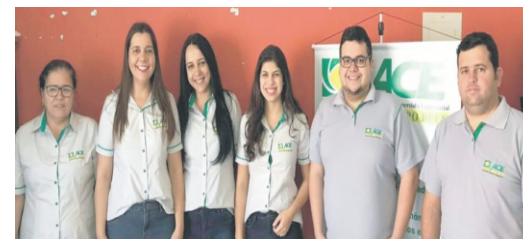
20/08 - Estreia uniforme ACECB