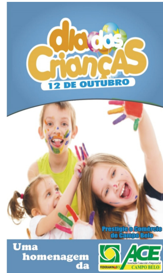
01/10 - início da Campanha Institucional de valorização do comércio local para o Dia das Crianças