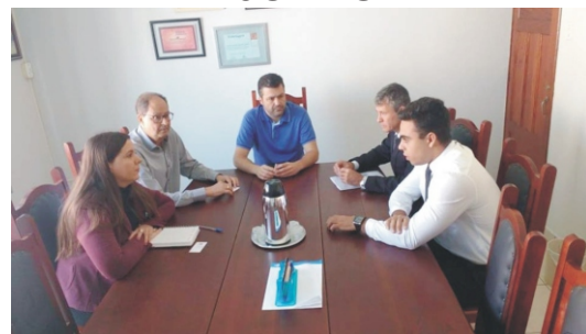
05/07 - ACE recebe a visita do Bradesco