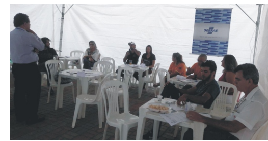
28 e 29/04 - 2º Feiccamp