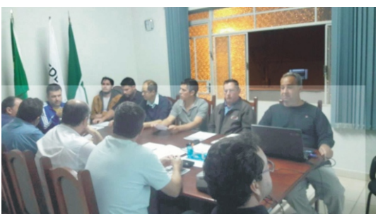
18/07 - Reunião ordinária da diretoria