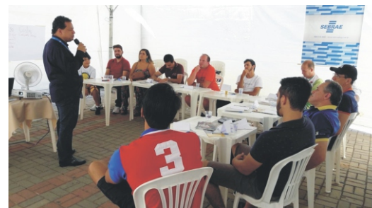
28 e 29/04 - 2º Feiccamp