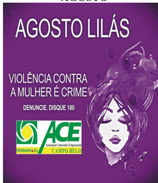
ACE adere a Campanha Agosto Lilás