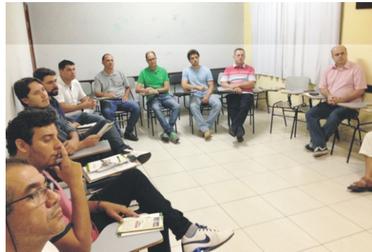
21/03 - Reunião de Posse da nova diretoria e Conselho Fiscal da ACE Gestão biênio 2018/2020