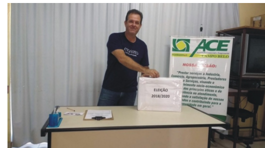
22/01 - Eleição Diretoria e Conselho Fiscal