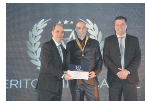
24/11 - Mérito Empresarial