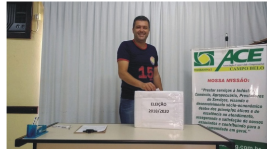
22/01 - Eleição Diretoria e Conselho Fiscal