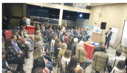
11/07 - ACE participa do Encontro de Negócios do Bradesco