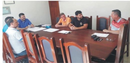
04/12 - 2ª Reunião de Planejamento Construção Sede Própria