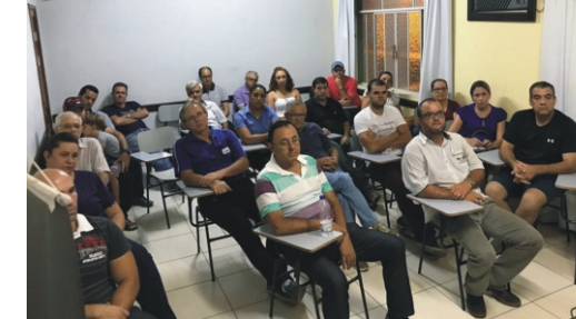
19/02 - Terceira Reunião Rede Comércio Protegido