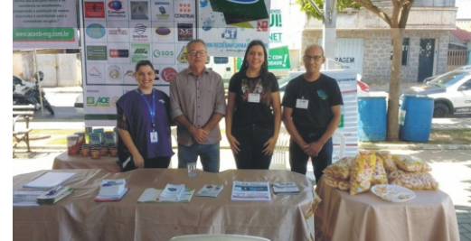
28 e 29/04 - 2º Feiccamp