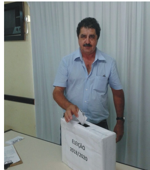
22/01 - Eleição Diretoria e Conselho Fiscal