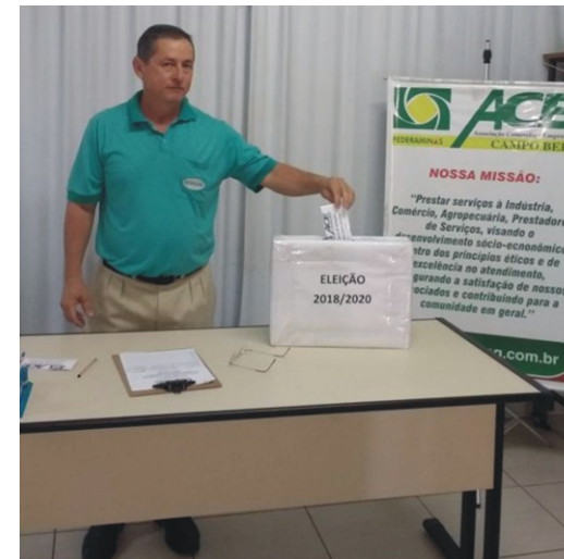
22/01 - Eleição Diretoria e Conselho Fiscal