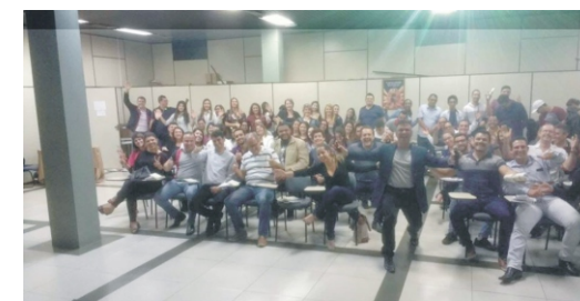
20/08 - Palestra Conhecendo a si mesmo - Atitude para o Sucesso