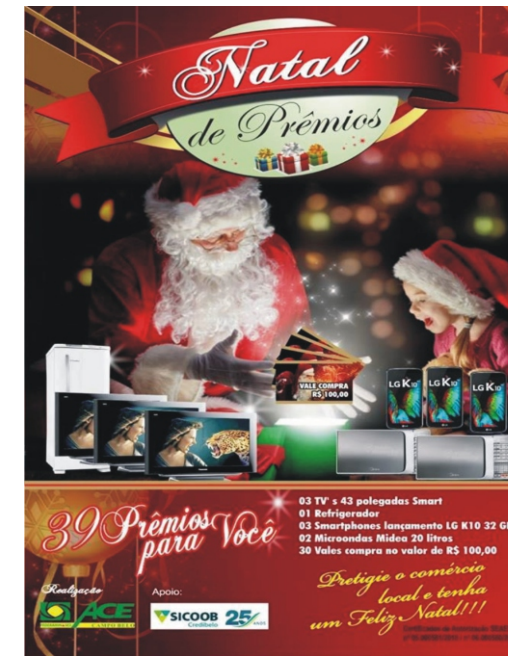
31/10 - Início da Campanha Natal de Prêmios