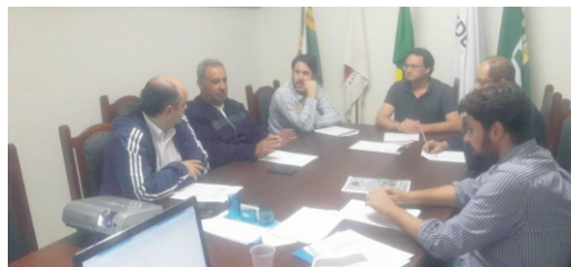
09/08 - Reunião Comissão Natalina