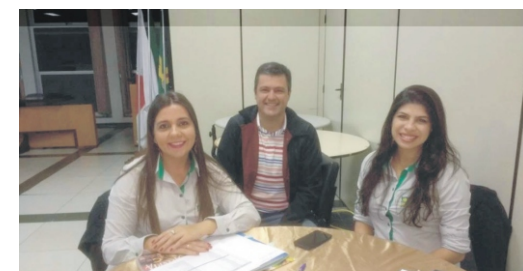
20/08 - Palestra Conhecendo a si mesmo - Atitude para o Sucesso