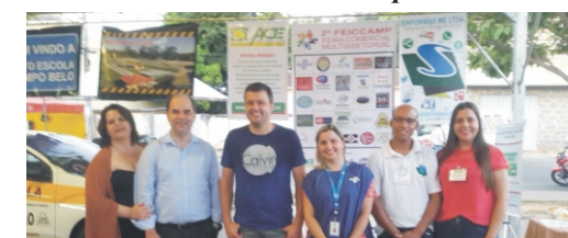
28 e 29/04 - 2ª Feiccamp