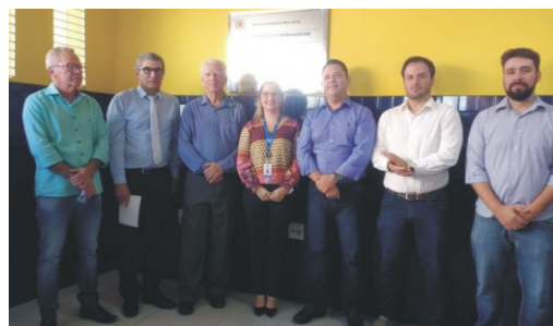
18/05 - Inauguração da Sala Mineira do Empreendedor