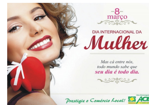
08/03 - Dia Internacional da Mulher