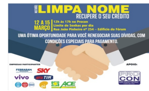
12 a 15/03 - Multirão Limpa Nome