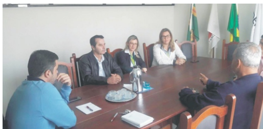
02/08 - Reunião Sicoob Credibelo Parceria POS e Natal