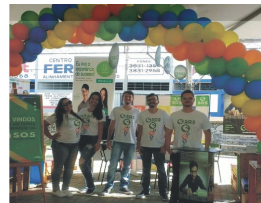
28 e 29/04 - 2º Feiccamp