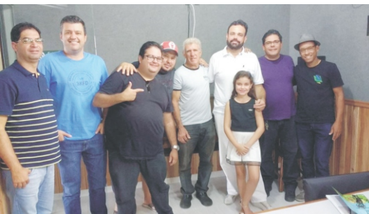
14/04 - Rádio Clube em Pauta com a presença da ACE e Rotary Club com a Pauta: 2º Feiccamp e Dia do Trabalhador