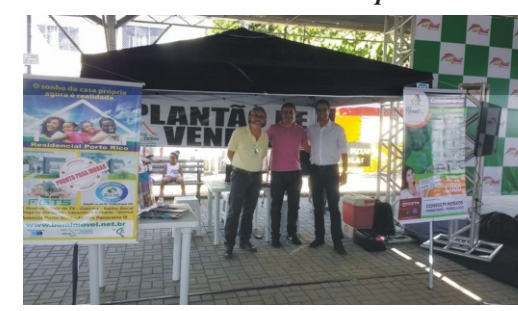
28 e 29/04 - 2ª Feiccamp