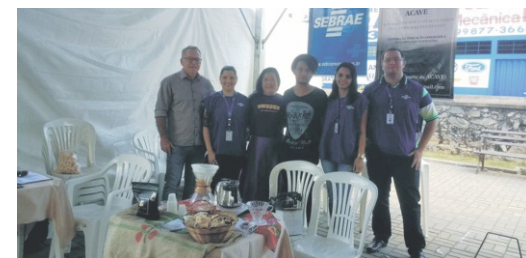
28 e 29/04 - 2º Feiccamp