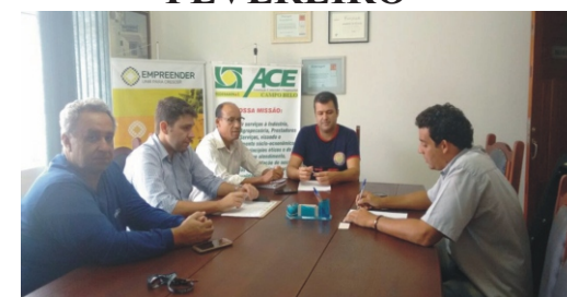
06/02-Reunião Planejamento Feiccamp