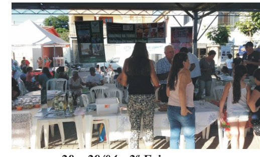
28 e 29/04 - 2ª Feiccamp