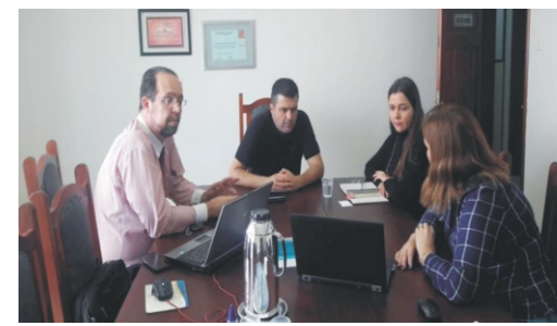
25/06 - ACE recebe a visita da Federaminas e Serasa Experian