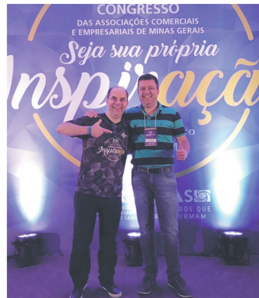
22 a 24/11-XXI-Congresso das ACE's