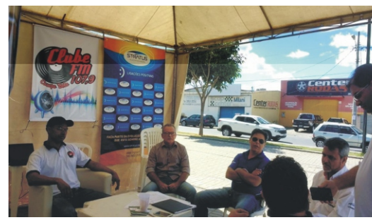
28 e 29/04 - 2ª Feiccamp