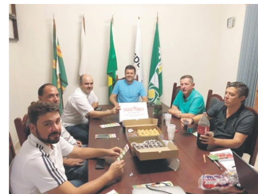
24/10-Reunião ordinária da diretoria