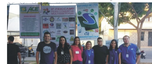
28 e 29/04 - 2ª Feiccamp