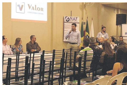
26 a 30/11 - Campanha Multirão Limpe seu Nome