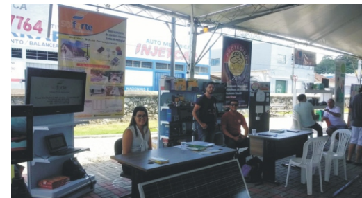
28 e 29/04 - 2º Feiccamp