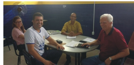
23/01 - Reunião Jovem Aprendiz e Feiccamp