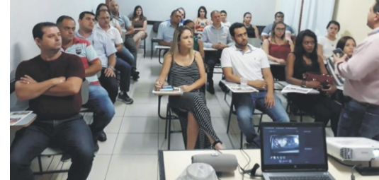
24/09 - Palestra Melhor suas vendas com criatividade