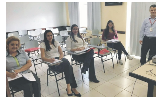
26/06 - Treinamento do BDMG