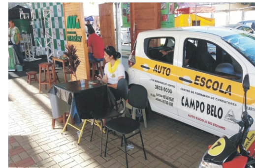
28 e 29/04 - 2ª Feiccamp