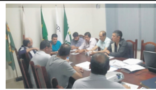
15/08 - Reunião ordinária da diretoria da ACE