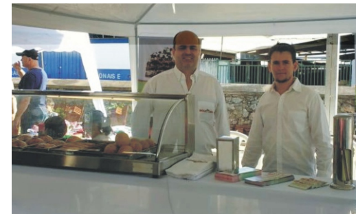
28 e 29/04 - 2ª Feiccamp