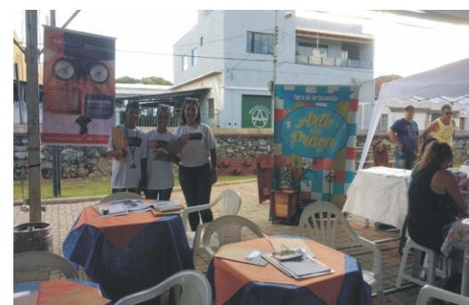
28 e 29/04 - 2ª Feiccamp