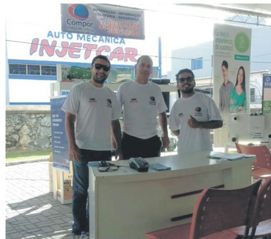
28 e 29/04 - 2ª Feiccamp