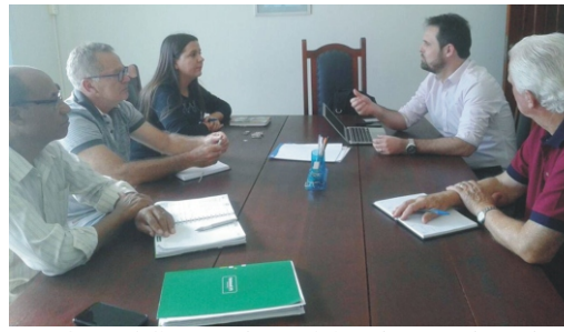
03/05 - ACE recebe a visita do coordenador estadual do Programa Empreender