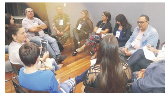
30/08-ACE participa de reunião promovida pela Prefeitura Municipal e Assistência Social referente a decoração Natalina SETEMBRO