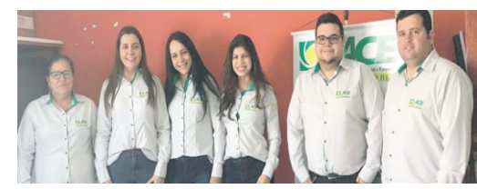
20/08 - Estreia uniforme ACECB