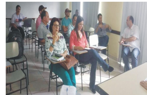
13/06 - Reunião de avaliação 2ª Feiccamp