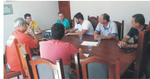
27/11 - Reunião de planejamento construção sede da ACE