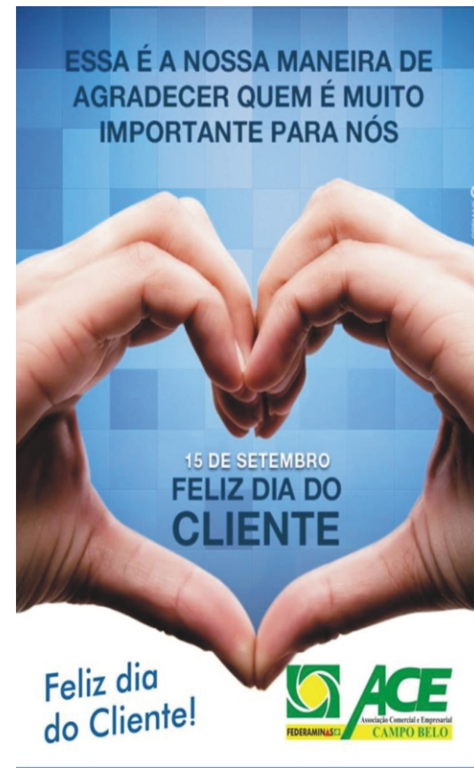
01/09 - Início da Campanha Institucional do Dia do Cliente