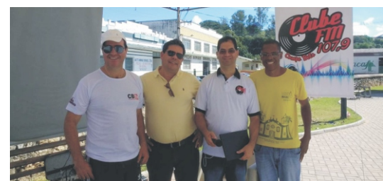
28 e 29/04 - 2ª Feiccamp