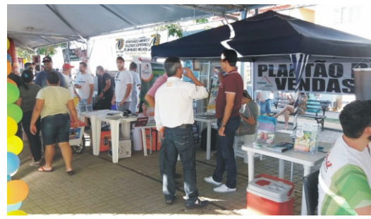
28 e 29/04 - 2ª Feiccamp