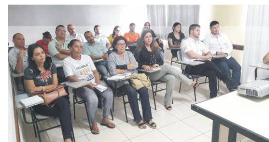
25/04 - Reunião com expositores 2º Feiccamp