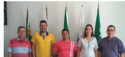
13-11-18 - ACE recebe a visita de vereadores referente ao lote da entidade