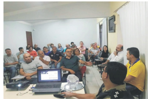
03/12 - 4ª Reunião da Rede Comércio Protegido