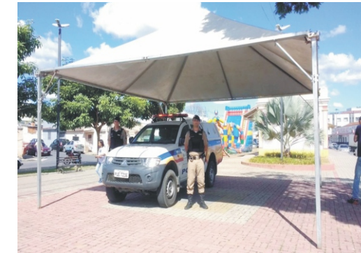
28 e 29/04 - 2ª Feiccamp