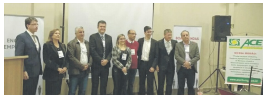
11/07 - ACE participa do Encontro de Negócios do Bradesco