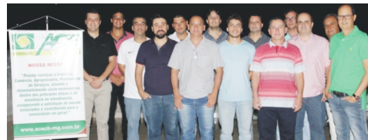
21/03 - Posse da diretoria e conselho fiscal 2018-2020