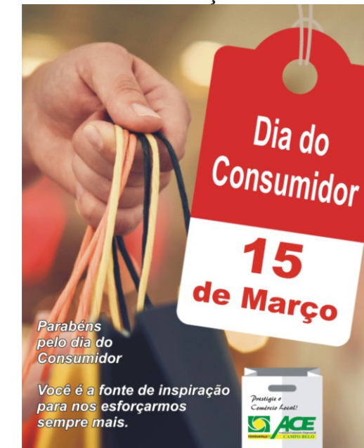
01/03 - Início da Campanha do Dia do Consumidor