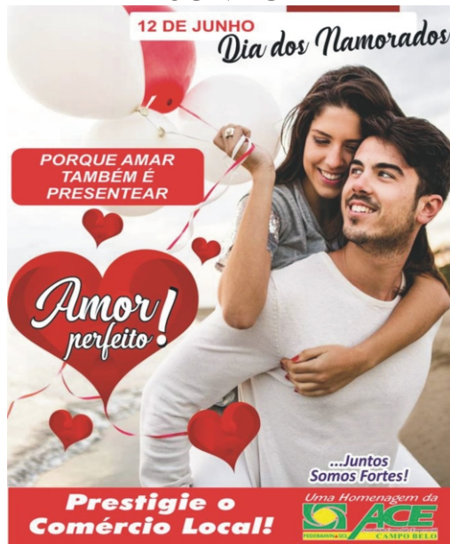
01/06 - Início da Campanha Institucional do Dia dos Namorados