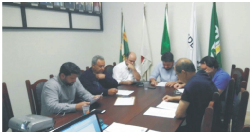
13/08 - 2ª reunião da comissão de Campanha Natalina