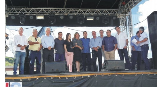
28 e 29/04 - 2º Feiccamp