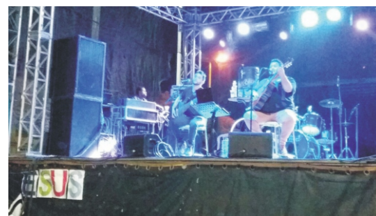
28 e 29/04 - 2ª Feiccamp