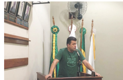
19/11 - Reunião Câmara Municipal