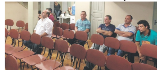
19/11 - Reunião Câmara Municipal