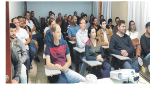
25/06 - Palestra Qualidade Atendimento ao Cliente