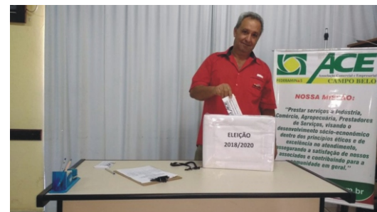
22/01 - Eleição Diretoria e Conselho Fiscal