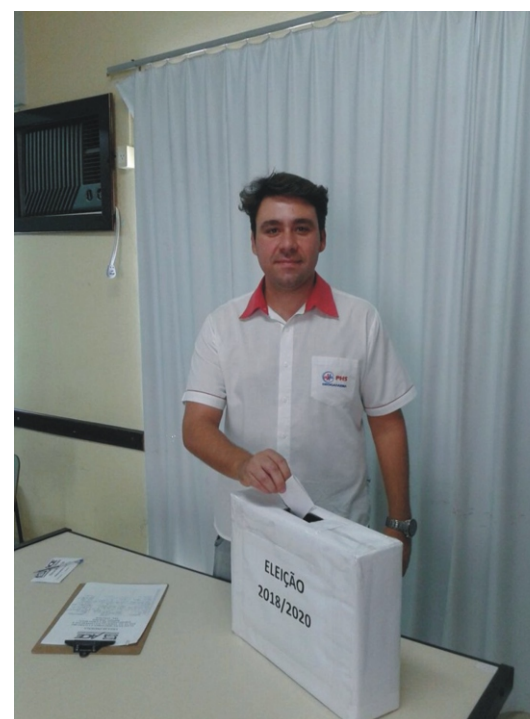
22/01 - Eleição Diretoria e Conselho Fiscal 27/11 - Comissão formada por diretores da ACE realizam reunião de planejamento da construção da sede própria.