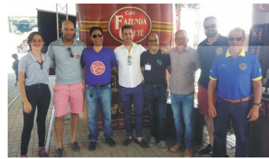
28 e 29/04 - 2ª Feiccamp