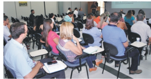
15/03 - Reunião Provin apresentação Jovem Aprendiz