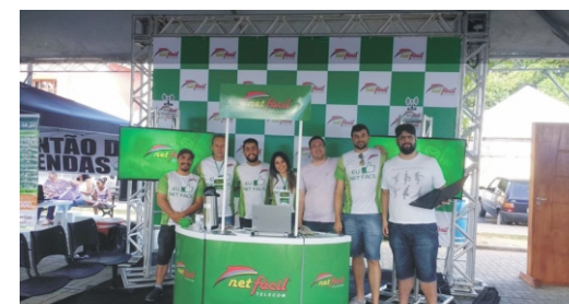
28 e 29/04 - 2º Feiccamp