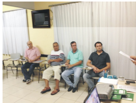
21/03 - Reunião de Posse da nova diretoria e Conselho Fiscal da ACE Gestão biênio 2018/2020