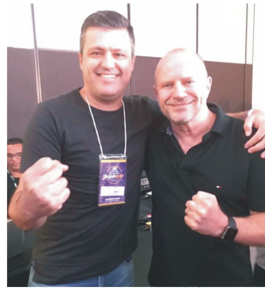
22 a 24/11-XXI-Congresso das ACE's