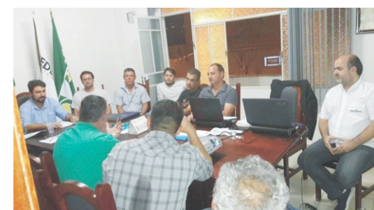
19/09 - Reunião ordinária da diretoria