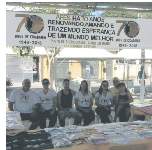
28 e 29/04 - 2º Feiccamp